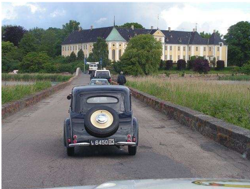
Også sidste år var der er kun een vej til Gavnø....