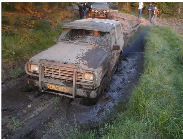
Rabatten, ja hele vejen, er blød her... FINDERUP Maj 2002