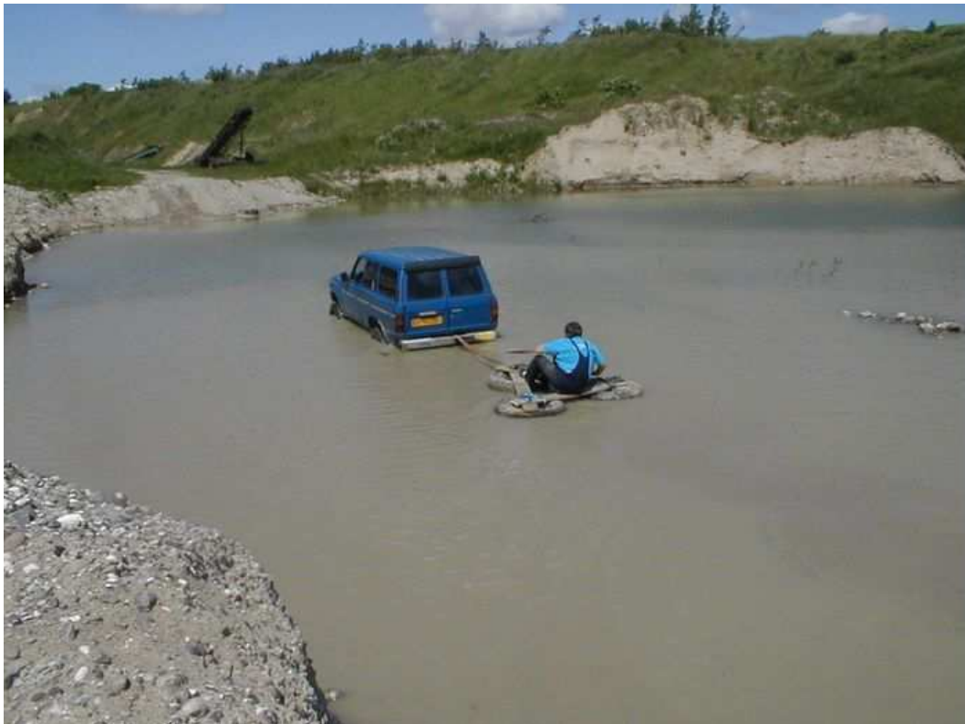
Flådeøvelse, Nr. Vedby Juni 2002