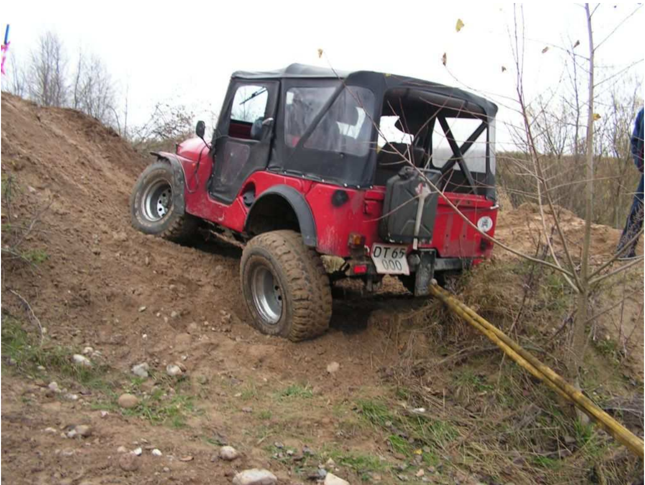
Systofte November 2005