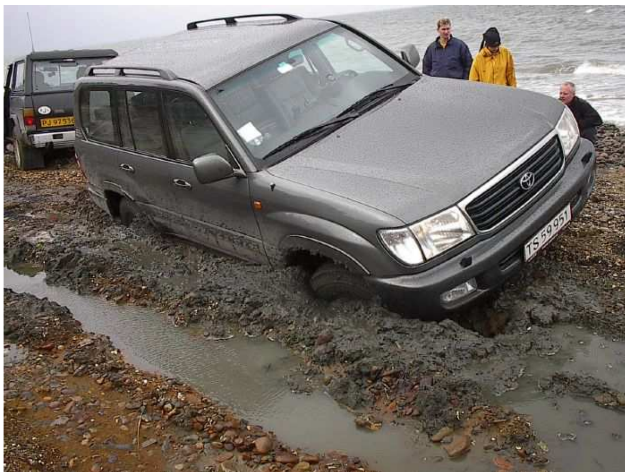
Regnskabet's time, Fur September 2001