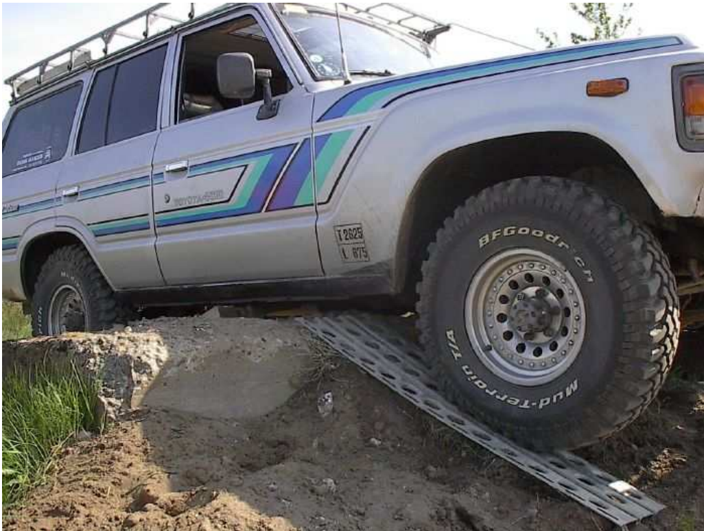
Forhindringsøvelse, Finderup, Maj 2002