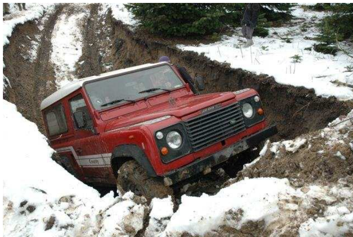
Gisselfeld Januar 2001, Landrover klubben

NB: Forbehold for udefra kommende prisændringer!