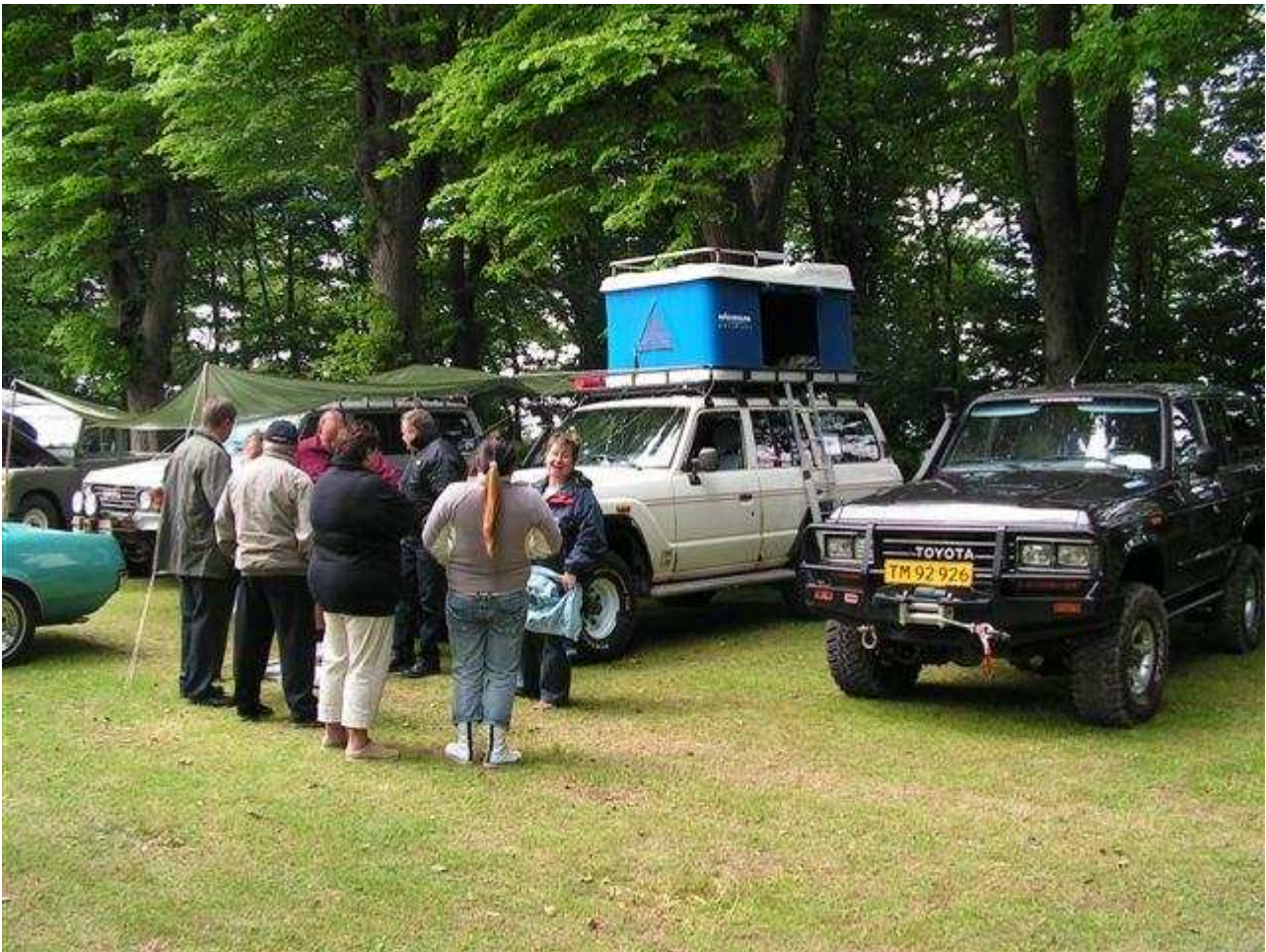
Her et indtryk fra sidste års klubstand

Gavnø Classix Autojumble & Concours de Charme afholdes søndag den 11. juni 2006.