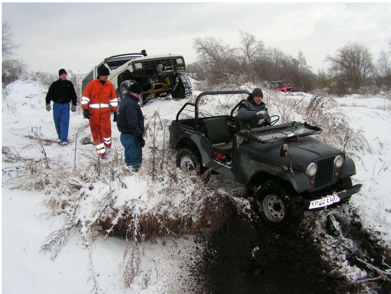
Hos Eg, Januar 2006, det ligner vor redacteur på en udfordrende dag....