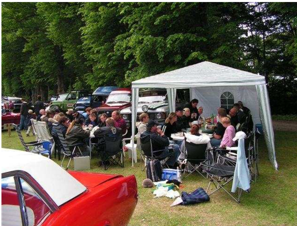
Frokosten sidste år ved den tid...