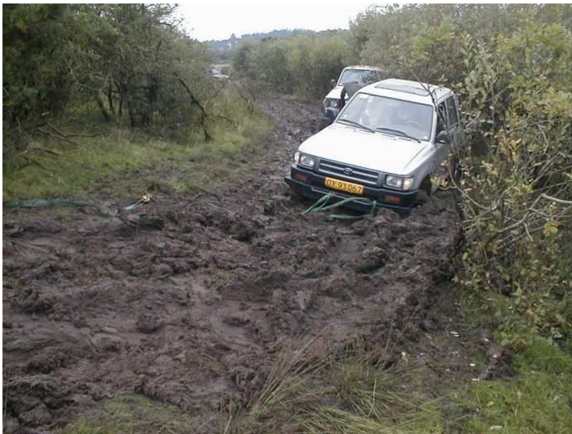
Fur, September 2001, Lange-Lasses Hilux har tabt momentet...