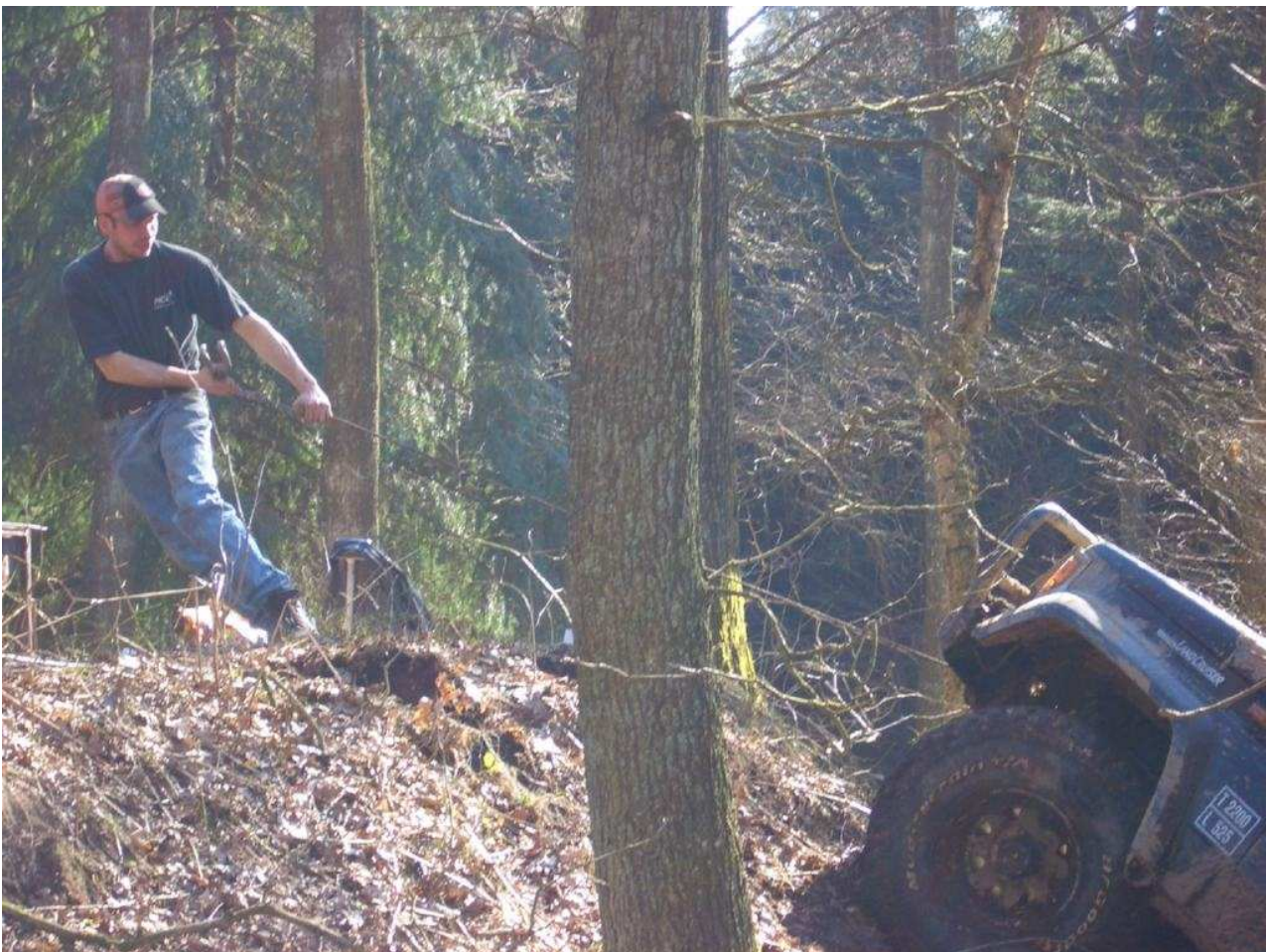
Gisselfeld, April 2005, for den som tror, er intet umuligt - men 080 Eik's 70'er er vist lige tung nok...

Nærmere oplysninger, herunder omkring arrangementer som endnu ikke er stedsat, samt evt. kørevejledning kan endvidere ses på klubbens hjemmeside, www.4x4.dk , efterhånden som tingene afklares.