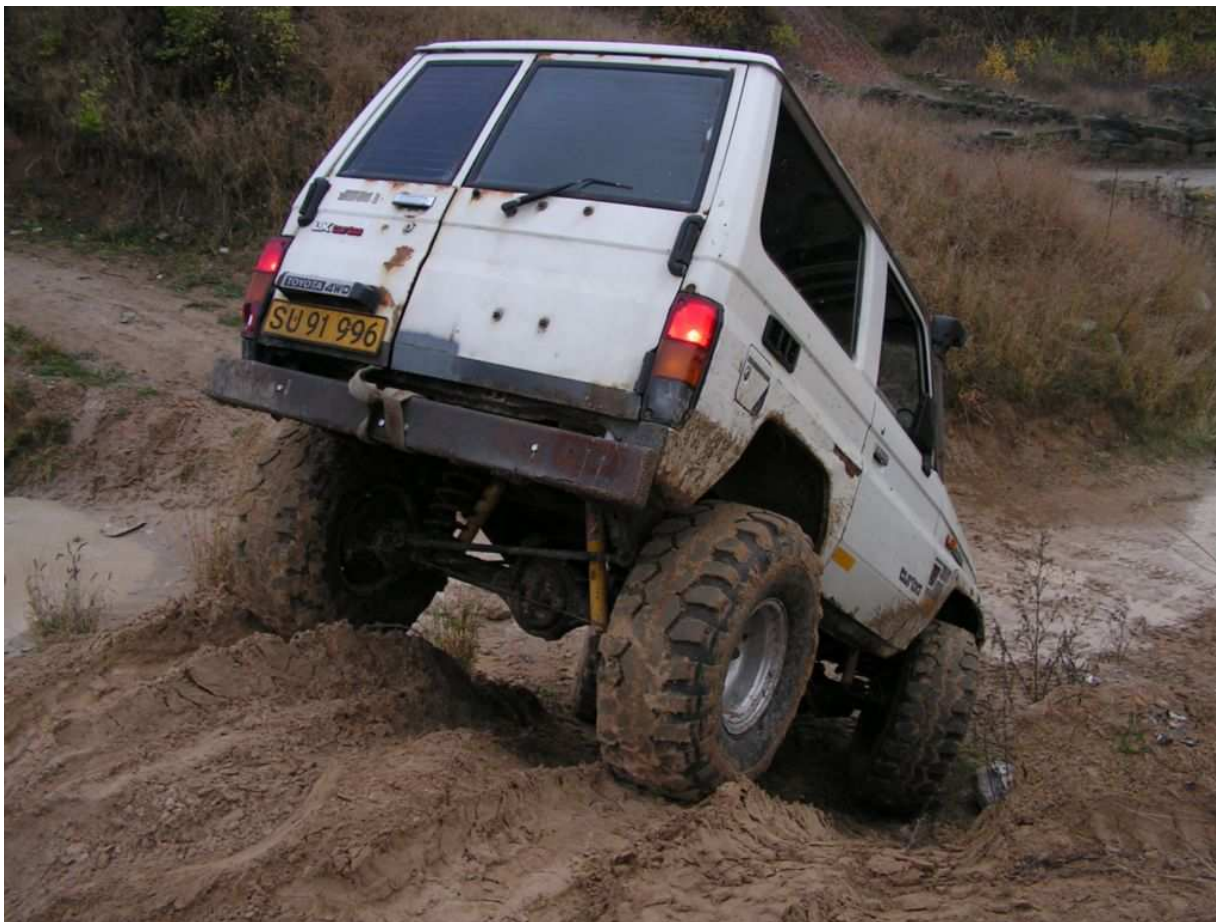
Systofte i november 2005

Det går ikke altid som præsten prædiker. Lige som vi (rettere 002 Nick) havde fundet os et godt terræn, kom amtet med en besked om, at der ikke måtte forekomme støj fra motorkøretøjer i området i weekenden.