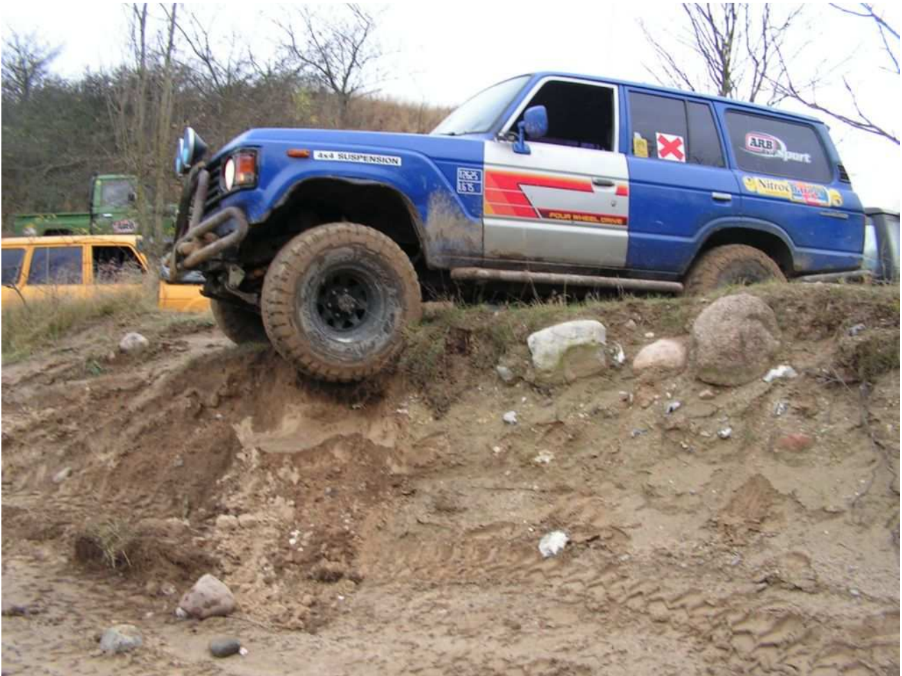
Systofte November 2005