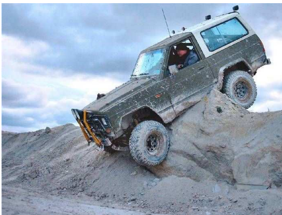
Balanceakt? Faxe Kalk Oktober 2002